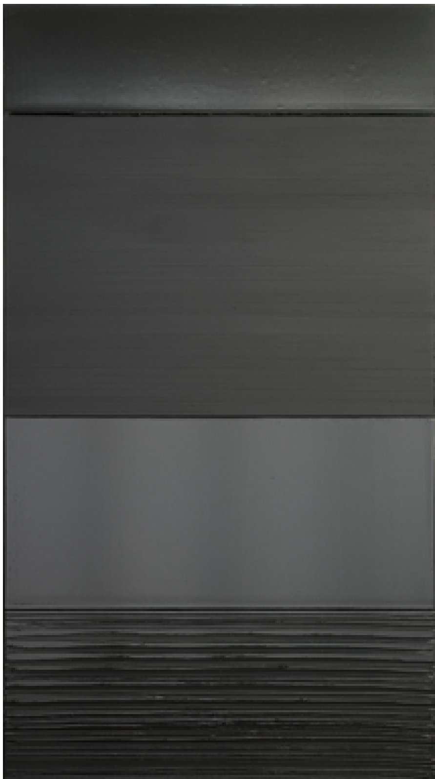
Pierre Soulages, Peinture, 324 x 181 cm, 17 mars 2005, acrylique sur toile, Inv. 2005.12.20.